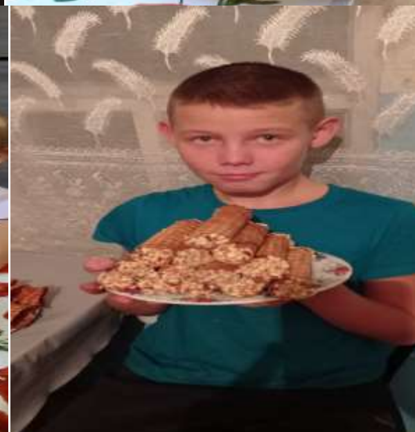
Обучающиеся с удовольствием и интересом принимали участие во всех мероприятиях.